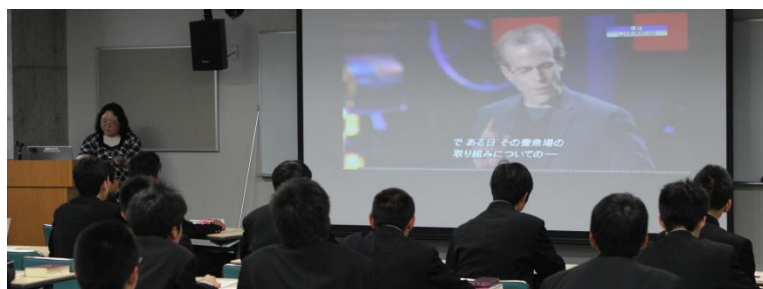
峰 教諭による 「インタビューをもとにした レポート・記事の作成」 の講座

全 7 回のうちの第 1 回目で、高校の先生方による 7 つの講座が開かれました。