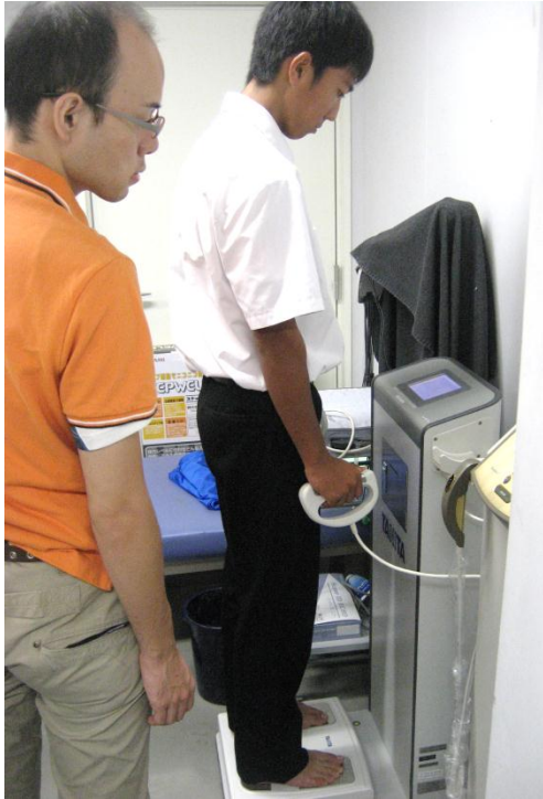
体重計に電極がついていて体脂肪が測定できます。簡単なものは家庭にもありますね