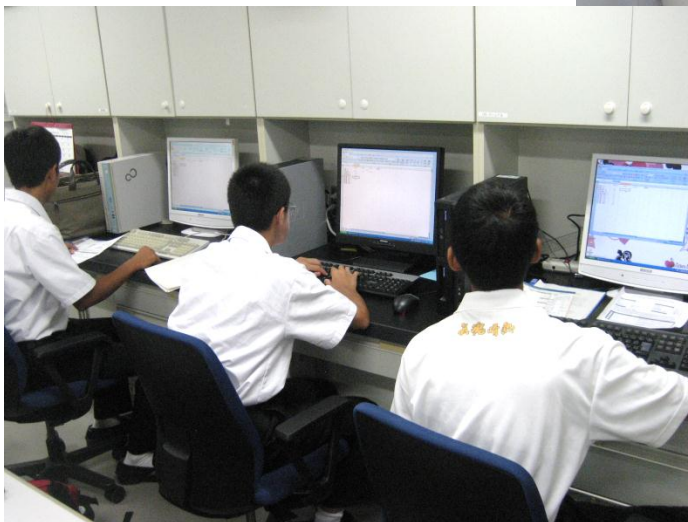
測定が終わったら、パソコンで体脂肪の計算