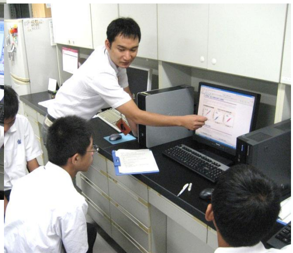
先生に指導を受けながらがんばりました。