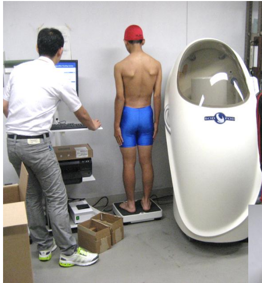
いよいよ、カプセルに入ります。体の体積を測ります。