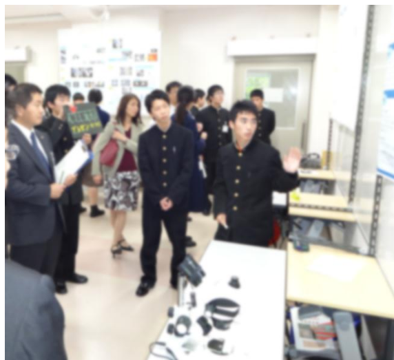
審査委員に説明をしています。